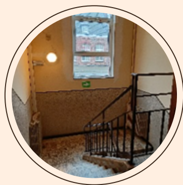
ESCALIERS DU BÂTIMENT 2000

Présentation du cours d'éducation physique et du projet « L'école sauve des vies ». Apprentissage des premiers gestes de secours ; réanimation cardiaque.