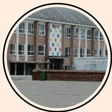
1ère entrée du bâtiment 3000